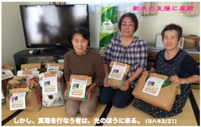
しかし、真理を行なう者は、光のほうに来る。(ヨハネ3/21)